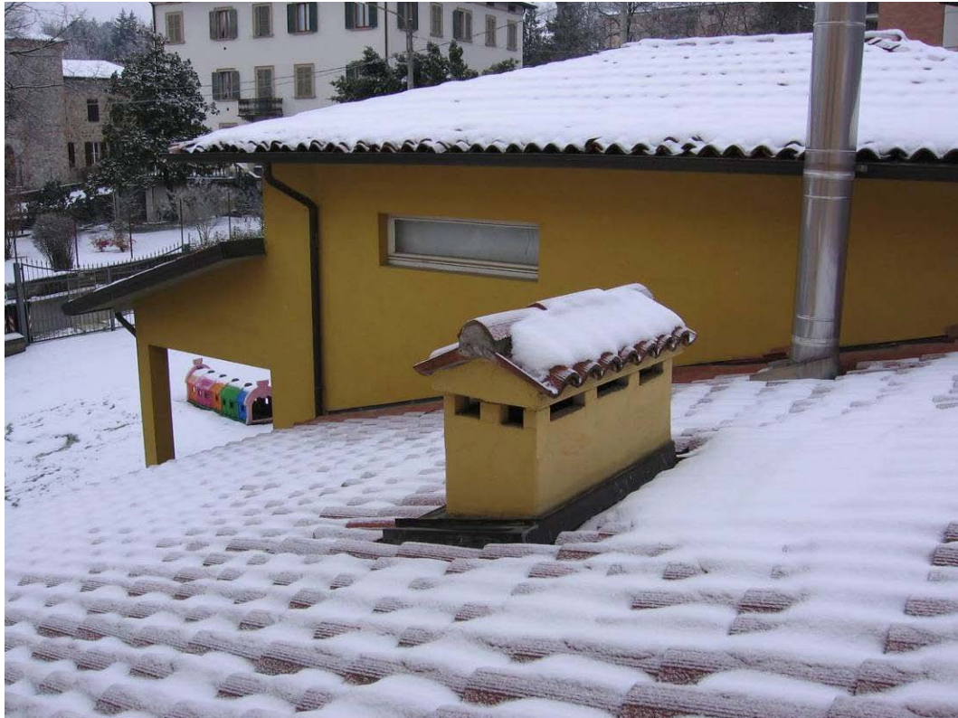
(3.2.3 V) Camino tozzo in muratura