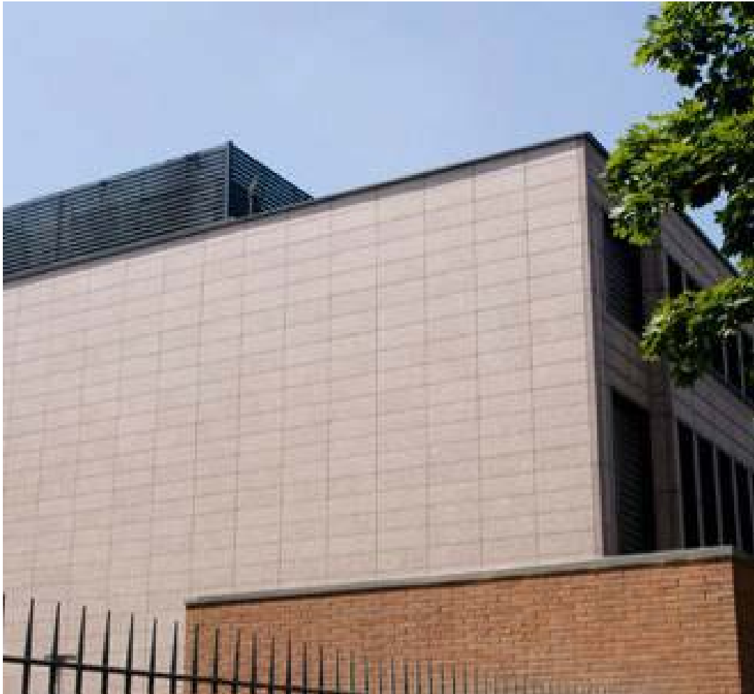
(3.4.2 V) Non sono visibili fessure o danneggiamenti negli elementi di rivestimento.