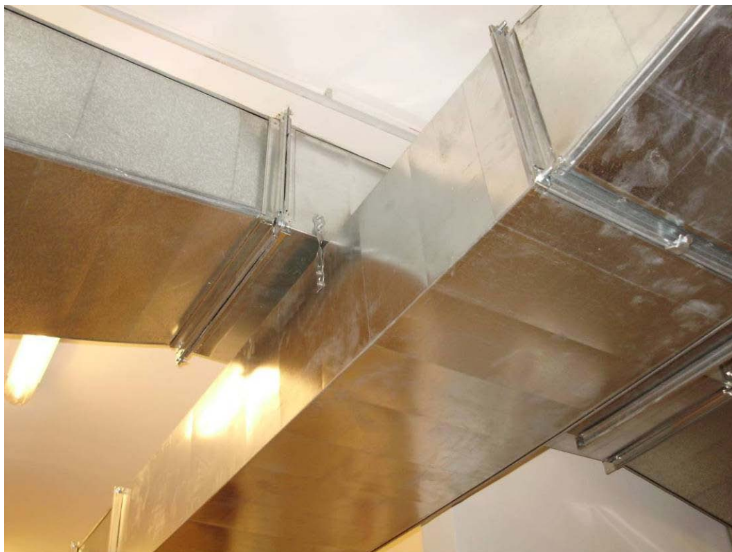
(3.6.3 F) Il condotto superiore è sostenuto da un altro condotto