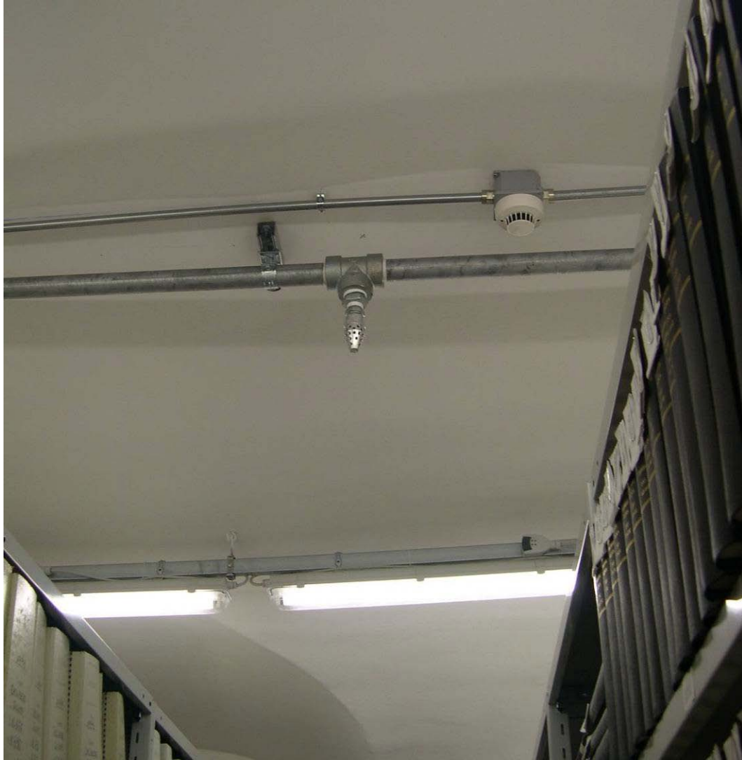
(3.6.1 V) Gli elementi di sostegno delle tubature del sistema antincendio appaiono adeguatamente ancorati