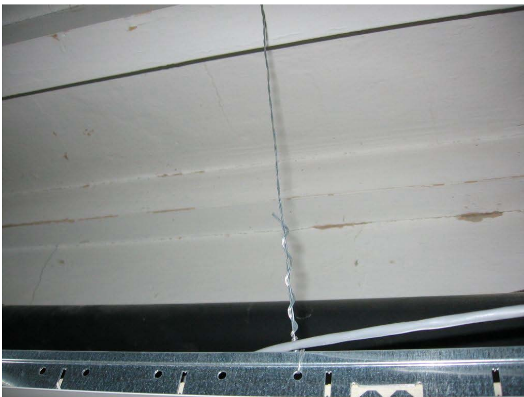
(3.1.3 F) I pendini non appaiono idonei a sostenere il controsoffitto relativamente pesante