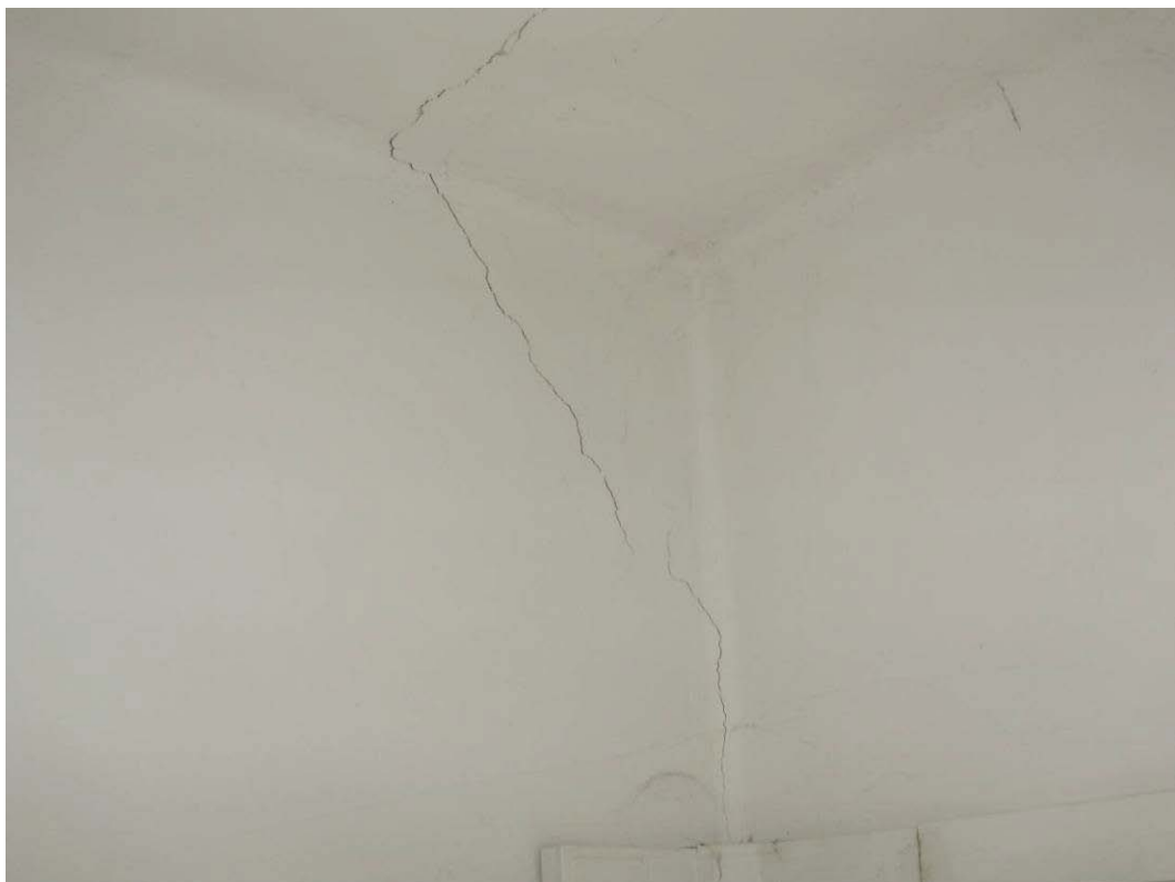
(3.1.1 F) Solaio in putrelle e tavelloni su parete in muratura con inizio di distacco di intonaco e danno strutturale