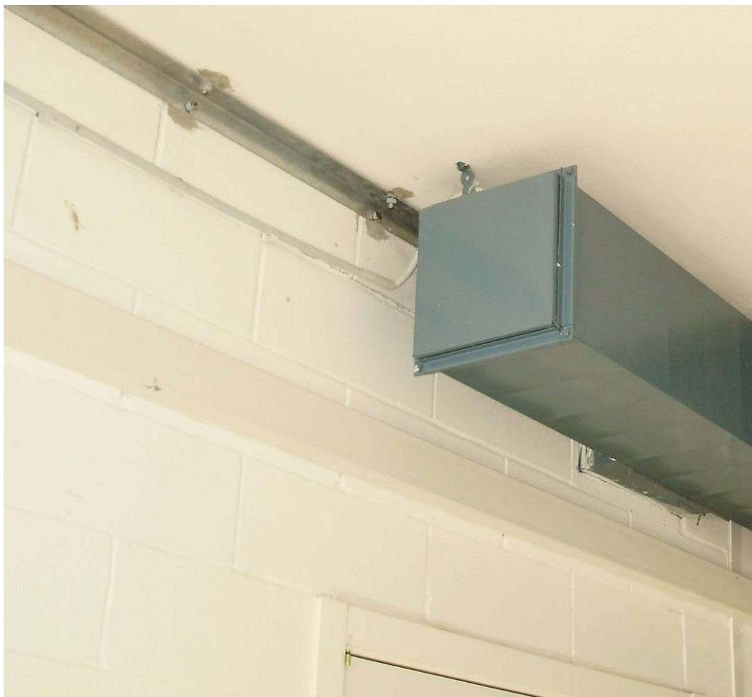
(3.3.1 V) le partizioni interne appaiono ben connesse alla struttura attraverso profili ad L ancorati al solaio