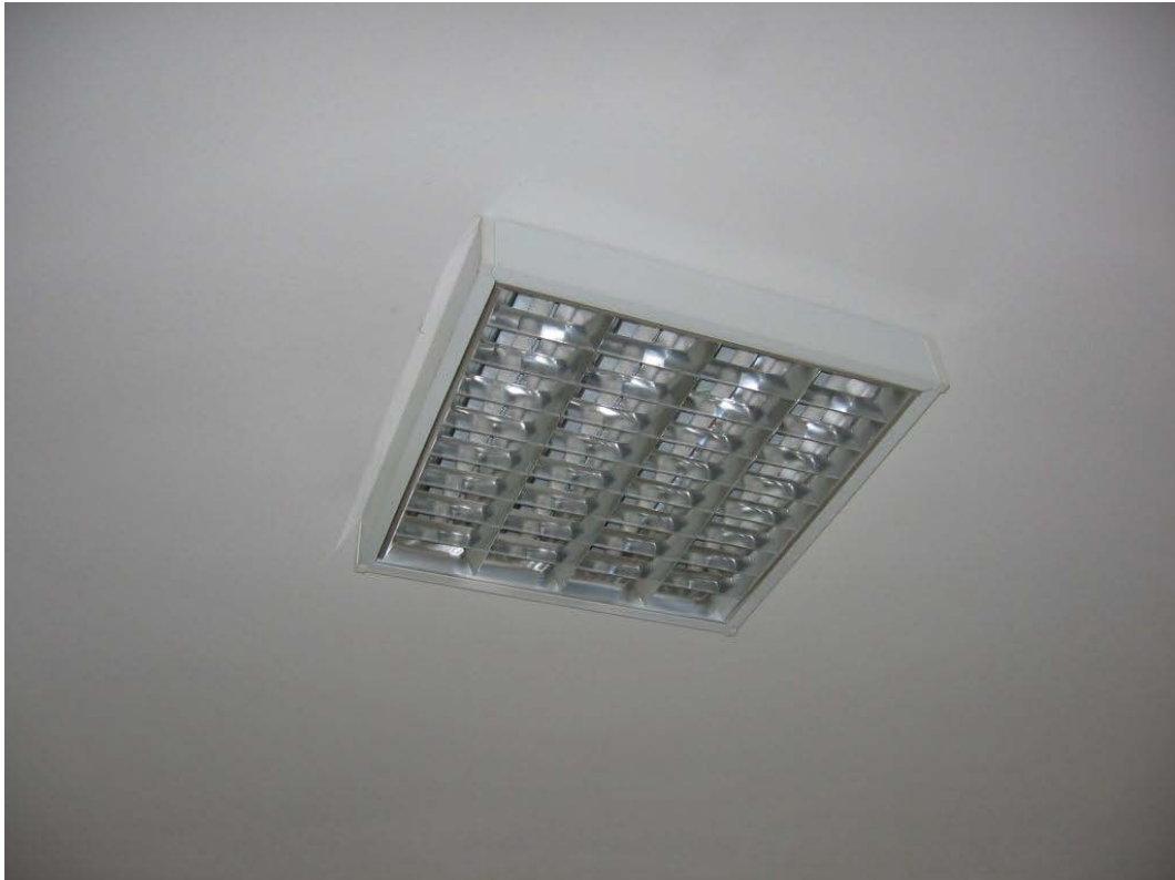
(3.1.1 V) Soffitto intonacato senza segni di degrado e di distacco dell'intonaco