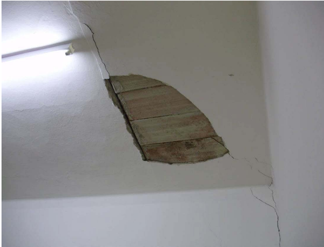
(3.1.1 F) Solaio in putrelle e tavelloni con intonaco distaccato; il tavellone è fuoriuscito dall'appoggio