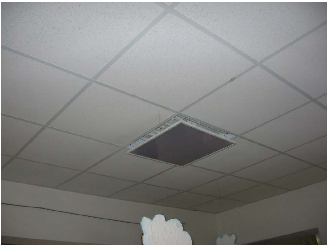
(3.1.2 V) Il controsoffitto non è realizzato con elementi in laterizio, né con elementi pesanti e fragili