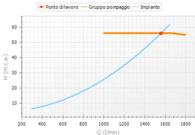
Fig. 3: Caratteristica H(Q) Impianto e Gruppo di pompaggio – Punto di lavoro