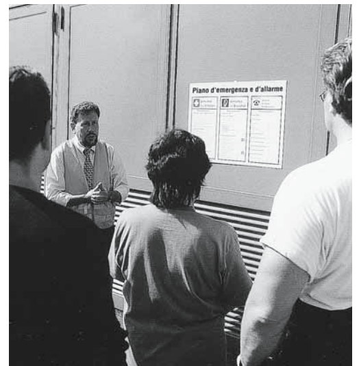
Figura 3: l'istruzione dei collaboratori è compito dei superiori.