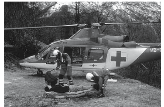
Figura 4: in caso di soccorso aereo definire le coordinate.

Per ulteriori informazioni: - Tessera per i casi di emergenza (codice Suva 88217/1.i) - Materiale di pronto soccorso per le aziende assicurate alla Suva: www.suva.ch/primosoccorso per tutti: www.sapros.ch/aziende/primosoccorso