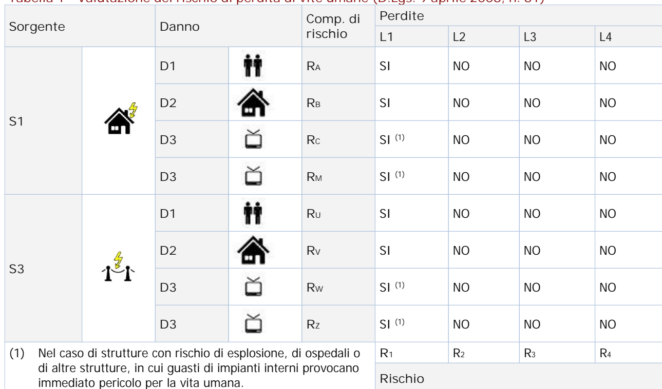
Tabella 1 - Valutazione del rischio di perdita di vite umane (D.Lgs. 9 aprile 2008, n. 81)

Pertanto, ai fini della valutazione del rischio di perdita di vite umane si deve provvedere a: